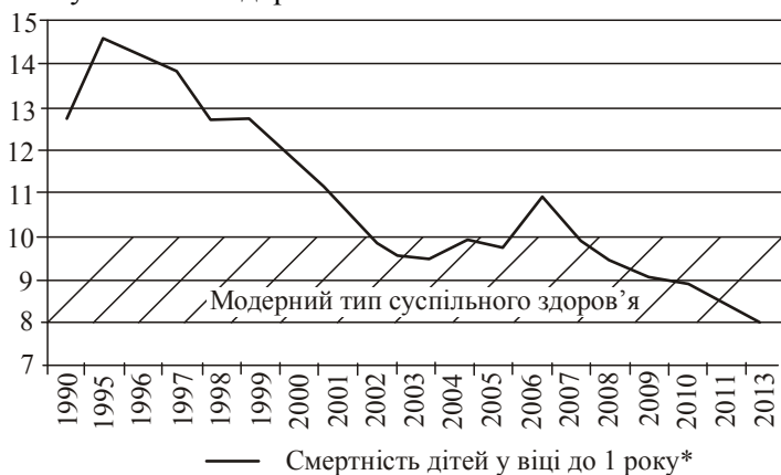
Рис. 1. Динаміка дитячої смертності на 1000 новонароджених в Україні за роки незалежності, побудовано авторами на основі [13]

Відповідно до значень показника дитячої смертності, можна зазначити, що протягом 2003—2013 рр. (за винятком 2007 р.) для країни був притаманний модерний тип суспільного здоров'я.