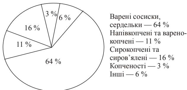
Рис. 2. Структура ринку м'ясних виробів за видами продукції у 2013 р., побудовано автором за [8]

лежить від сировинної бази, а їх збут обмежений місцем виробництва та прилеглими районами. Структура ринку ковбасних виробів відображена на рис. 2.