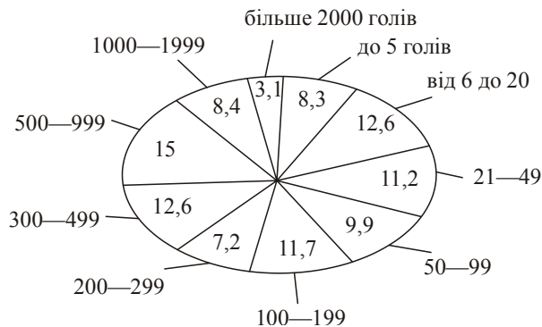
Рис. 2. Групування сільськогосподарських підприємств за чисельністю поголів'я великої рогатої худоби на початок 2014 р. [11, 12]

При цьому підприємства, що займалися молочним скотарством, були дрібнотоварними. Так, у 270 найбільших господарствах вироблялось половина всього молока в категорії сільгосппідприємств, а близько чверті молока в Україні було вироблено двадцятьма холдингами (рис. 2).