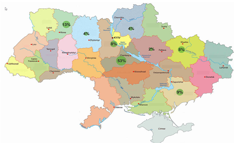
Рис. 3. Розподіл обсягу виробництва органічних круп по областях країни у 2017 році

Географія обсягу виробництва найбільших вітчизняних виробників органічних круп розроблена за даними [13,11] та наведена на рис. 3. Серед них варто виділити такі: ТОВ «Фірма «Діамант ЛТД», ТОВ «Органік оригінал», ТОВ «Органік лайф», ПП «Агроєкологія», ТОВ «Кварк», ТОВ «Цефей-Групп», ТОВ «Агрофірма «Поле», ТОВ «Адоніс Люкс», ПП «Галекс-Агро», ТОВ «Дедденс Агро», ТОВ «Сквирський комбінат хлібопродуктів». У сумі вони виробляють левову частку органічних круп в Україні.