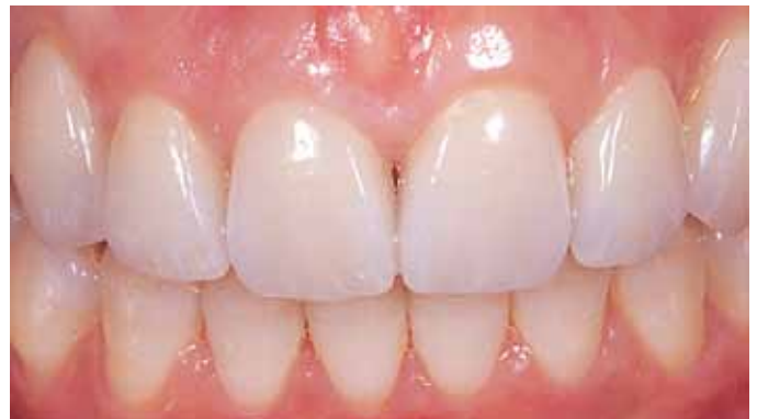
Мал. 13. Вініри (колір A1.5) in situ