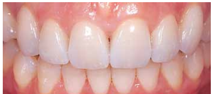
Мал. 15. Кінцевий результат через 3 роки in situ

редніх і жувальних зубів. Вініри пресують на основі повністю анатомічної воскової моделі. Для моделювання природної структури мамелонів частину кераміки в різцевій третині усувають. Індивідуальні характеристики відтворюють за допомогою спеціальних пастоподібних барвників (Modifier Sky Blue, MM yellow-orange, MM reddish-orange, high value та ін.), які спікають при температурі 650 ° С. Потім вініри облицьовують масами IPS Empress Esthetic Veneer Incisal Opal LT, MT, NT і Incisal White, Orange. Враховуючи молодий вік пацієнтки, ді-