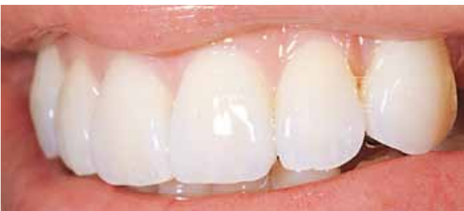
Мал. 14. Лінія усмішки. Вигляд дещо збоку