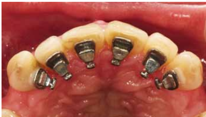
Мал. 6. Брекети з язикової сторони дають можливість провести препарування губної поверхні і виготовити відбиток