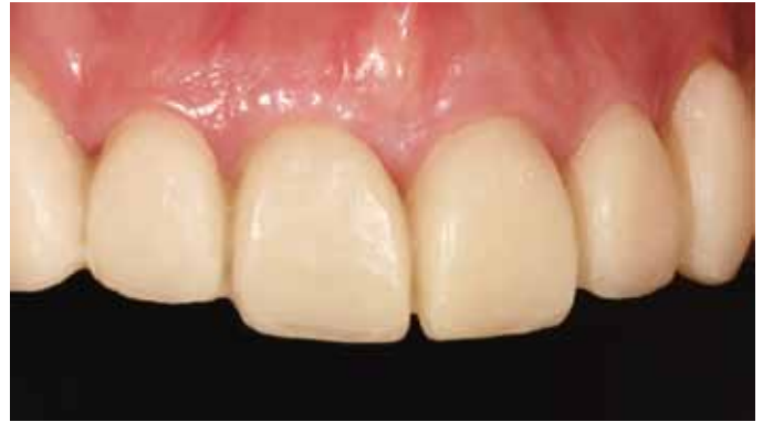
Мал. 11. Тимчасові полімерні вініри in situ