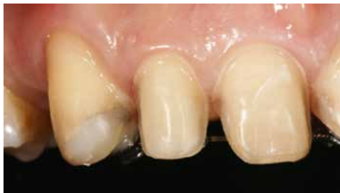
Мал. 9. Збільшене зображення препарованих зубів

Для оцінки функціональних і естетичних характеристик виготовляють воскову модель реставрації (Wax-up). На основі Wax-up на моделі виготовляють силіконовий шаблон, який згодом використовують для контролю глибини препарування зубів і наявності достатнього вільного простору для виготовлення вінірів (мал. 8). На мал. 9 і 10 зображено збільшені знімки препарованих зубів. Одночасно на основі Wax-up виготовляються тимчасові по-