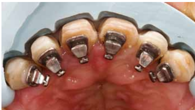
Мал. 8. Контроль вільного простору за допомогою силіконового шаблону