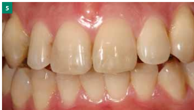
Мал. 4, 5. Через 6 місяців ортодонтичного лікування пацієнтці не вистачило терпеливості. Вона забажала негайно виготовити постійну реставрацію. На цих знімках зображено вихідну ситуацію