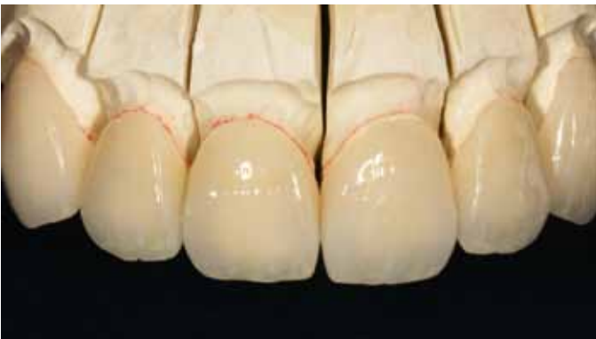
Мал. 12. Готові вініри IPS Empress Esthetic на моделі