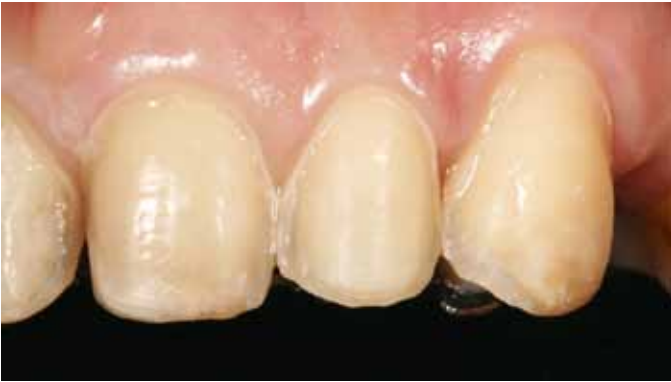
Мал. 10. Збільшене зображення препаративних зубів