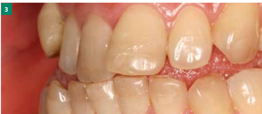
Мал. 1-3. Виражена скупченість і неправильне розміщення зубів потребує попереднього ортодонтичного лікування перед протезуванням