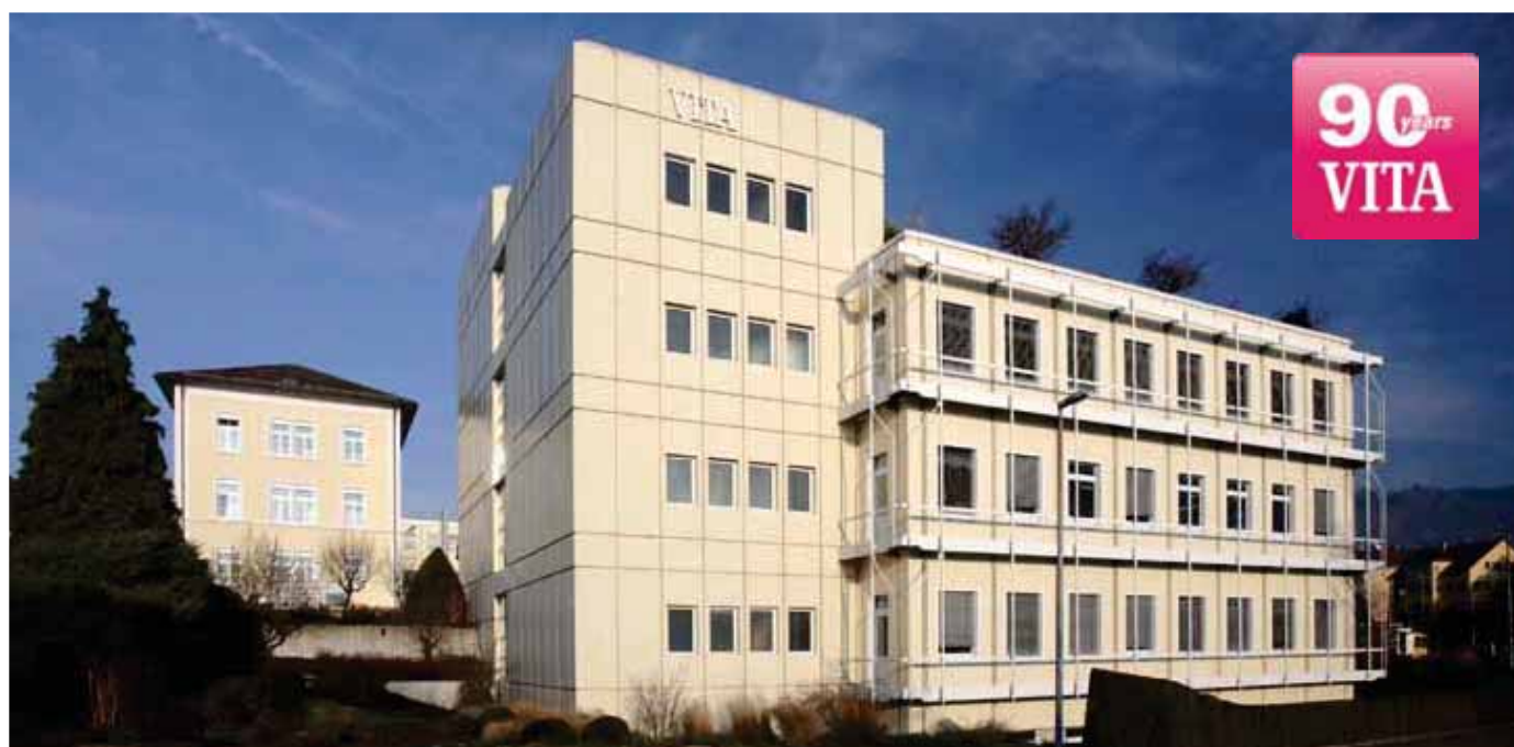
Будівля заводу VITA Zahnfabrik у м. Бад Зекінген

Назва компанії «VITA» як лідера, який задає тон у ділянці визначення кольору та кераміки, увійшла та закріпилася у мові як загальна назва, також цьому