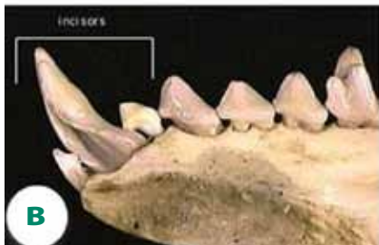
Мал. 4. Отрутовидільна система, пов'язана з зубами: а — гаїтянський щілинозуб; б — отруйний другий нижній різець щілинозуба; в — отруйні зуби змії

ротовій прицільній рентгенограмі альвеолярного відростка верхньої щелепи справа в ділянці зуба 16 відзначили полікістозне розрідження кісткової тканини діаметром близько 1,3 см. Ендодонтично зуб не лікований, бухта правої верхньощелепної пазухи прослідковується чітко, без патологічних змін (мал. 1).