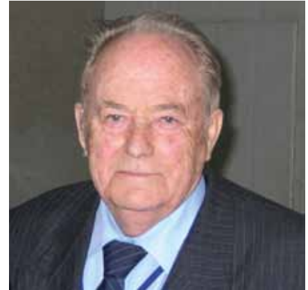
Професор Евальд Янович Варес

Від 1959 року професійна діяльність Евальда Яновича Вареса пов'язана з Україною, де відомий лікар успішно працював до кінця своїх днів. Після проходження конкурсу у 1959 році розпочав діяльність на посаді завідувача відділу ортодонції Одеського науководослідного інституту стоматології, отримавши звання старшого наукового співробітника. У той час під керівництвом Евальда Яновича були виконані три кандидатські дисертації з питань морфологічної перебудови тканин пародонта та ділянок шовного з'єднання [4]. У 1965 році обраний на посаду завідувача кафедри ортопедичної стоматології Донецького медичного інституту, в 1967 році успішно захистив докторську дисертацію на тему «Закономірності росту лицевого скелета і їх значення для практичної ортодонції», а в 1968 році отримав звання професора. У 1972 році розпочався найтриваліший