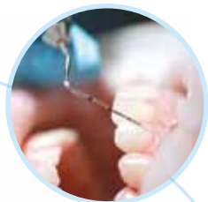
2. Зондування з використанням інструментів

Я дуже сподіваюся, що завдяки зусиллям наших лекторів і за суттєвої підтримки компанії «ІнСпе» в деяких клініках нашої країни рівень пародонтологічного прийому став вищим. Інтерес до наших курсів постійно зростає, цього року ми провели 5 додаткових курсів. Загалом у 2015 р. наші практичні курси і лекції відвідали понад 400 осіб, а це доводить, що ми зацікавили наших лікарів та гігієністів. Мета Школи — підвищити рівень практичної пародонтології в Україні.