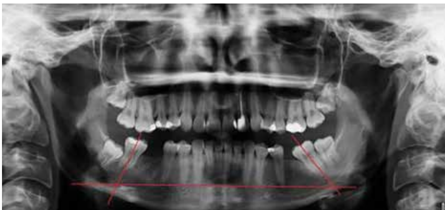
Мал. 1. Методика вимірювання ангуляції других молярів нижньої щелепи на ОПГ пацієнта I групи дослідження до ортодонтичного лікування

надмірної ангуляції, що може компроментувати результати ортодонтичного лікування, спричиняти перевантаження тканин пародонта та виникнення рецидивів [1, 6, 11]. Використання ортодонтичних міні-імплантатів як анкоражної опори при потребі значних переміщень зубів обґрунтоване малоінвазійним характером хірургічного втручання, можливістю застосування методики в умовах складних клінічних випадків, доказовою ретроспективною ефективністю їх використання та можливістю скорочення терміну комплексної реабілітації пацієнтів [2, 4, 9]. Зокрема, Р.Г. Оснач та О.А. Беда [3] проводили мезіалізацію зубів, що дистально обмежують дефект зубного ряду, за допомогою ортодонтичного апарата власної конструкції у пацієнтів віком від 18 до 40 років. У результаті лікування пацієнтів усіх груп було відмічено, що переміщення молярів у ділянку дефекту залежить від періоду між видаленням зуба і початком використання ортодонтичного апарата. Більш швидке переміщення спостерігали у випадку, коли проміжок часу між видаленням і фіксацією апарата не перевищував 2-4 тижні. Також було продемонстровано швидше переміщення молярів у молодшій віковій групі від 18 до 24 років, порівняно з середньою (25-30 років) і старшою (31-40 років) групами. Проте автори не досліджували зміни кісткової тканини навколо зубів, що підлягали мезіаліза-