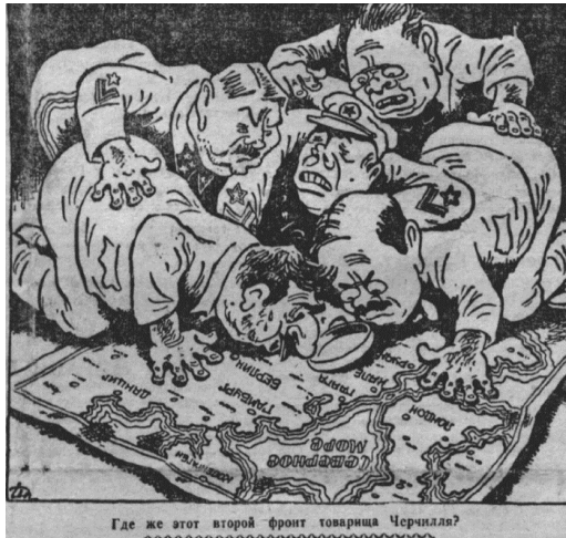
Мал. 3. Донецкий вестник, 23 августа 1943 г.

Другою за популярністю темою карикатур газети «Донецкий вестник» була внутрішня політика СРСР. На шпальтах окупаційної преси не стільки висміювалась, як засуджувалась антирелігійна та антиукраїнська політика Сталіна, колективізація та пов'язані з ними репресії. Сталін зображувався як здоровезний орел із величезними вусами та утрираними рисами обличчя, що підкреслювали його національність (читай – інакшість) (мал. 4), поставав у вигляді кровожерливого м'ясника, який для досягнення своїх цілей знищує народ (мал. 5). Супроводом подібних карикатур часто-густо виступали приклади народного (ймовірніше, авторського) 12 фольклору – антирадянські частівки, прислів'я, загадки.