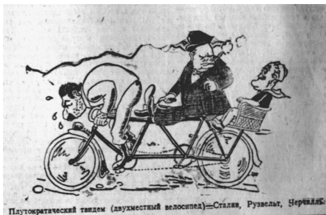
Мал. 2. Донецкий вестник, 1 августа 1943 г.

У зображеннях карикатуристів Черчилль, Рузвельт та Сталін часто сварились, підставляли один одного. Водночас постійно акцентувалося на принизливому становищі Сталіна порівняно з його союзниками, що у карикатурах відбивалося зображенням Сталіна завжди в нижній частині малюнка щодо Рузвельта та Черчилля (мал. 2). Зважаючи, що одним із найпопулярніших сюжетів карикатур був другий фронт (мал. 3), то цілком зрозумілим є нав'язування у свідомості населення окупованих територій теми розбрату між союзниками, щоб виключити надії навіть на можливість домовленостей про спільні дії.