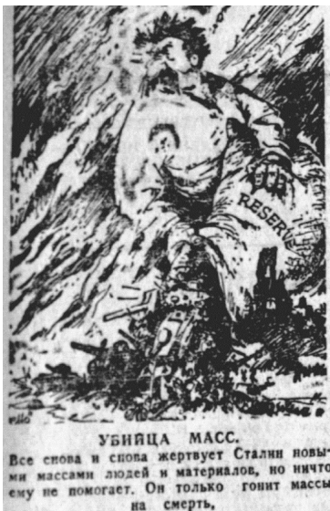
Мал. 4. Донецкий вестник, 4 августа 1943 г.

Другою за популярністю темою карикатур газети «Донецкий вестник» була внутрішня політика СРСР. На шпальтах окупаційної преси не стільки висміювалась, як засуджувалась антирелігійна та антиукраїнська політика Сталіна, колективізація та пов'язані з ними репресії. Сталін зображувався як здоровезний орел із величезними вусами та утрираними рисами обличчя, що підкреслювали його національність (читай – інакшість) (мал. 4), поставав у вигляді кровожерливого м'ясника, який для досягнення своїх цілей знищує народ (мал. 5). Супроводом подібних карикатур часто-густо виступали приклади народного (ймовірніше, авторського) 12 фольклору – антирадянські частівки, прислів'я, загадки.