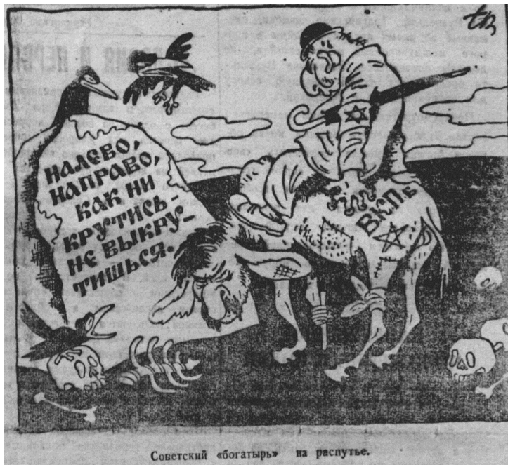
Мал. 7. Донецкий вестник, 6 сентября 1942 г.

Як зазначалося вище, одним із головних питань, яке ставить дослідження, чи була політична карикатура на шпальтах окупаційної преси дієвою та чи мала той вплив на населення, який передбачався окупантами. На жаль, наявні джерела не дозволяють дати вичерпні відповіді на ці запитання. На території окупації періодичні видання були чи не єдиним джерелом інформації для населення, вакуум якої поповнювався саме з відомостей наявної преси. І все ж населення досить скептично ставилося до змісту окупаційної преси – «німецькі газети брешуть ще більше за радянські» 13 . Інша справа карикатура. За висновком відомого дослідника політичного гумору А. В. Дмитрієва, «через використання візуального каналу впливу або критично націленого на окрему важливу тему символу політична карикатура стає дієвим засобом формування суспільної думки. Її апеляції до емоцій взагалі важко протистояти, і її вплив доволі помітний до теперішнього часу» 14 . Але карикатура