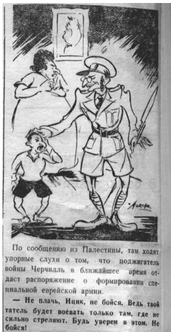
Мал. 6. Донецкий вестник, 11 июня 1942 г.

Ще одним із сюжетів, який викривався політичною сатирою, був антисемітизм. Антисемітська пропаганда займала доволі значне місце на шпальтах видання, проте, що стосується карикатур, то антисемітських сюжетів у «Донецкому вестнику» набагато порівняно з іншими, до того ж вони зазвичай були супровідними. Наприклад, карикатура, яка висміювала начебто створення єврейського полку в армії Великобританії (мал. 6). Антисемітизм не пропагувався на побутовому рівні, критикувалось «жидо-більшовицьке» походження радянської влади та не єврей Сталін, який співпрацював з євреями проти свого ж народу (мал. 7).