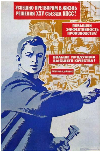
Малюнок 9 17