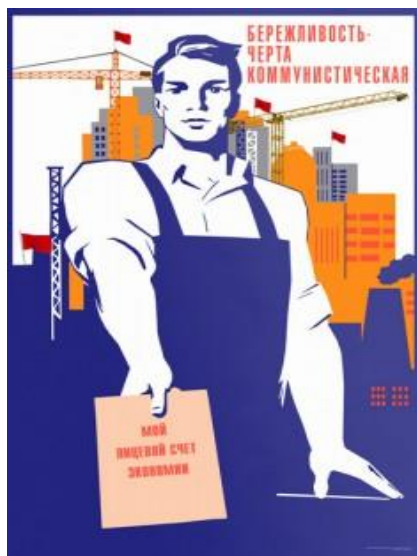
Малюнок 7 15