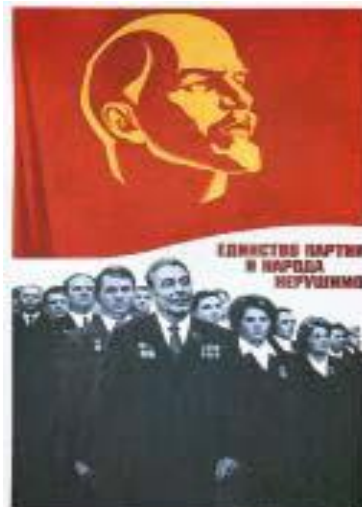
Малюнок 3 9

Дещо по-іншому вибудовується принцип дії іншого типу великої плакатної фігури – «героя» («бога», «втілення публічного простору»), який наділений рисами портретної схожості з конкретною публічною особою і має моментально сприйматися глядачем. У цьому разі вплив плаката збільшувався за рахунок кількох додаткових факторів. По-перше, в багаторазовій повторюваності, яка сприяла інтеріоризації не тільки «плакатних осіб», а й інших елементів відповідних візуальних кодів. По-друге, за рахунок особливої організації плакатного візуального простору в його співвіднесеності з тими великими за площею просторами, в які воно вписано 8 .