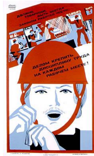
Малюнок 2 7

Дещо по-іншому вибудовується принцип дії іншого типу великої плакатної фігури – «героя» («бога», «втілення публічного простору»), який наділений рисами портретної схожості з конкретною публічною особою і має моментально сприйматися глядачем. У цьому разі вплив плаката збільшувався за рахунок кількох додаткових факторів. По-перше, в багаторазовій повторюваності, яка сприяла інтеріоризації не тільки «плакатних осіб», а й інших елементів відповідних візуальних кодів. По-друге, за рахунок особливої організації плакатного візуального простору в його співвіднесеності з тими великими за площею просторами, в які воно вписано 8 .