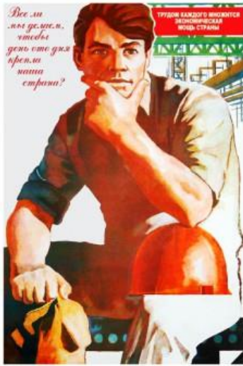
Малюнок 1 6