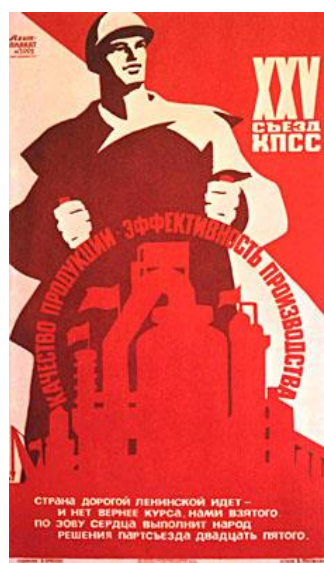
Малюнок 8 16