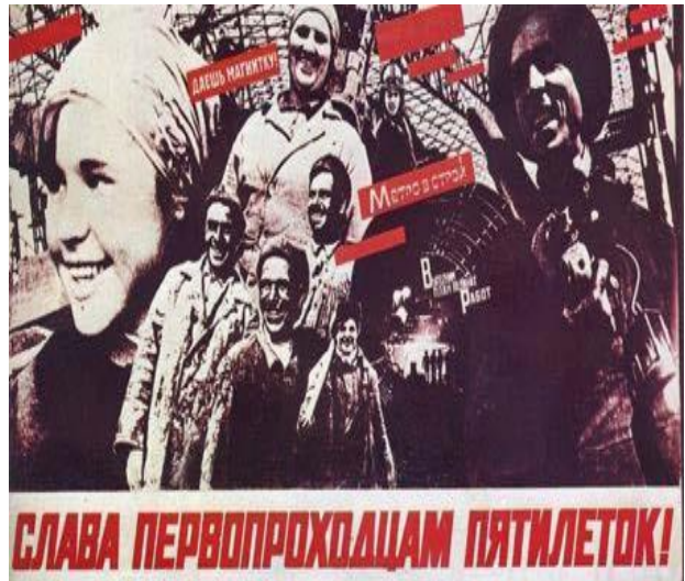
Малюнок 10 18

До того ж проба реанімувати трудовий ентузіазм була приречена на поразку через об'єктивні обставини. Насамперед через домінування моральних стимулів над матеріальними. Другою важливою обставиною було те, що реанімація ентузіазму розгорталася в умовах споживчої революції, що набирала силу. Поглиблення споживчої революції стало саме тим благодатним ґрунтом, на якому виростили нові уявлення про працю.