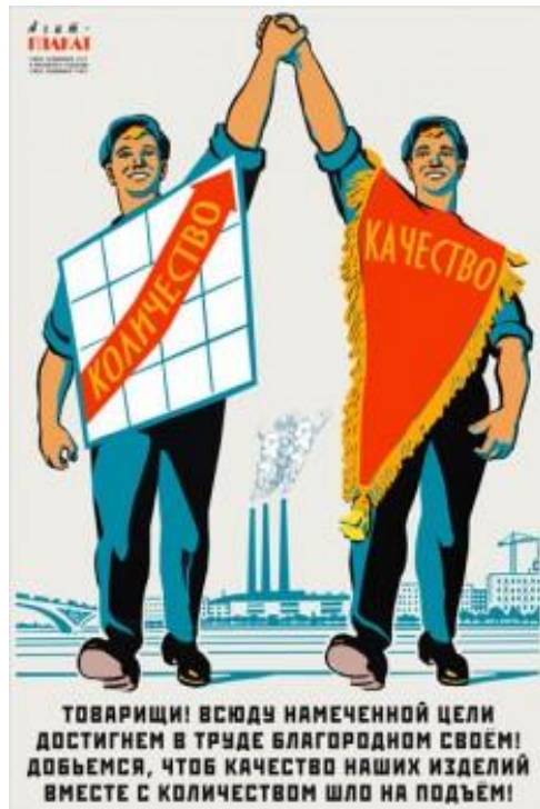
Малюнок 6 14