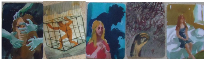
Рис. 3. Ілюстрації образу Я в переживаннях залежності

Яким же чином вибудовується, конструюється світ, Я, образ партнера, способи взаємодії, коли залежність починає переживатися? Описуючи досвід залежності, досліджувані розповідають про теперішні стосунки, в яких намагаються розібратися. Це досвід актуальних переживань. Слід зазначити, що досліджувані мало говорять про залежність як таку, більша частина їхньої розповіді присвячена переживанням. Вони говорять про відчуття холоду, брак повітря (“ось-ось закінчиться повітря”), постійну недостачу чогось, вражене почуття гордості та достоїнства, передчуття подальшого приниження, власної безпорадності. Образ Я знаходить своє відображення в картинках, що передають ці тяжкі переживання: гнітючий біль, самотність, замкнутість (рис. 3).