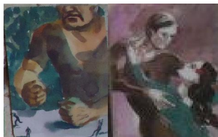
Рис. 4. Ілюстрації образу партнера в переживаннях залежності

Партнер зображується зовсім інакше. У розповіді він постає як непохитний; “його внутрішні настановлення на себе дуже міцні, незалежні, незважаючи ні на які обставини. Йому притаманна внутрішня режимність, методичність”. Поряд з непохитністю згадуються холодність та агресивність: “зі своєї позиції він руйнує все, що для мене є важливим” (рис. 4).