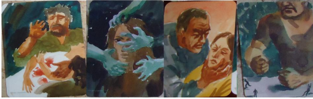
Рис. 2. Ілюстрації станів, яких досліджувані намагаються уникати

виконувати партнер; рис, які, він повинен мати, щоб стосунки були гармонійними і незалежними.