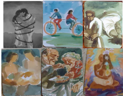
Рис. 5. Ілюстрації взаємодії в переживаннях залежності

описується, як заради кохання вона пожертвувала своїми друзям, як багато часу витратила на те, щоб вибудувати гармонію в сім'ї, як відмовилася від професійних амбіцій. Картинки, в яких зображена така взаємодія, говорять про вимушеність і неможливість окремішності, відчуження. А проте виділяється чимало картинок, на яких такі стосунки ідеалізуються (рис. 5). Говорячи про стратегії взаємодії, досліджувані згадують в основному про підлаштовування, покору, підпорядкування: “Щоб стати для нього цікавою, я змушую себе дивитися футбол, але ще більше починаю усвідомлювати, наскільки ми різні”.