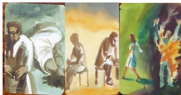
Рис. 7. Ілюстрації протистояння

Таким чином, контури залежності в уявленнях досліджуваних представлені у феноменологічному полі як уявлення про межі можливостей реалізації свого ціннісно-сміслового буття. Крім того, важливим є рівень фіксованості на цих настановленнях. Адже в житті людини перевірка детермінаційних впливів не єдиний цікавий процес. Крім владно-підвладних коливань, у стосунках чимало й інших площин взаємодії. Коли стратегії протистояння чи підпорядкування стають основною метою – це ризик для стосунків.