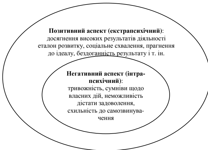
Рис. 1. Екстра- та інтрапсихічний аспекти перфекціонізму

На думку автора, не варто поділяти перфекціонізм на позитивний і негативний, адже в такому випадку позитивний перфекціонізм ототожнюється із самоактуалізацією [3] і розвиваються критерії виокремлення одного й другого, хоча це не одне і те ж саме. Отже, перфекціонізм – цілісне явище, в якому поєднуються як позитивні аспекти, так і негативні, що відрізняються лише площинами прояву (рис. 1).