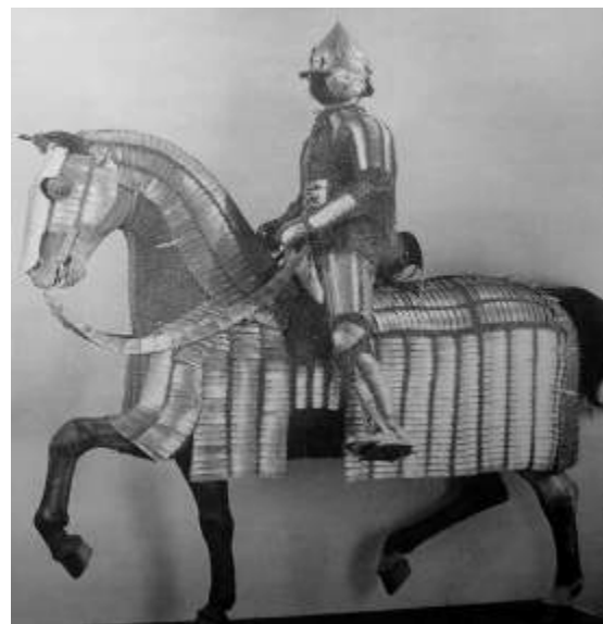
Рис. 3. Важкоозброєні: західноєвропейський лицар та турецький сипах 16 століття.

Середня вага бойових лицарських обладунків, за матеріалами дослідників-зброєзнавців, на середину-кінець 15 століття досягала, у середньому, близько 30 кілограмів, ще до 40-60 кілограмів могли важити кінські обладунки; у повному варіанті – налобник з бойовим рогом, рухомий пластинчастий нашійник, нагрудник, інколи з бойовими шипами, броньоване сідло із захистом паху та попереку лицаря й металевий