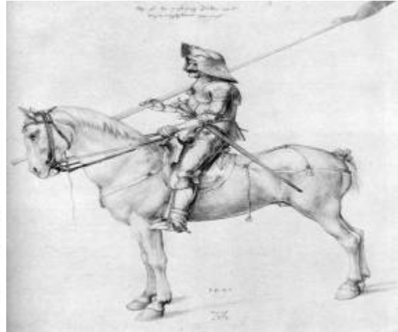
Рис. 2. Посадка лицаря на коні.