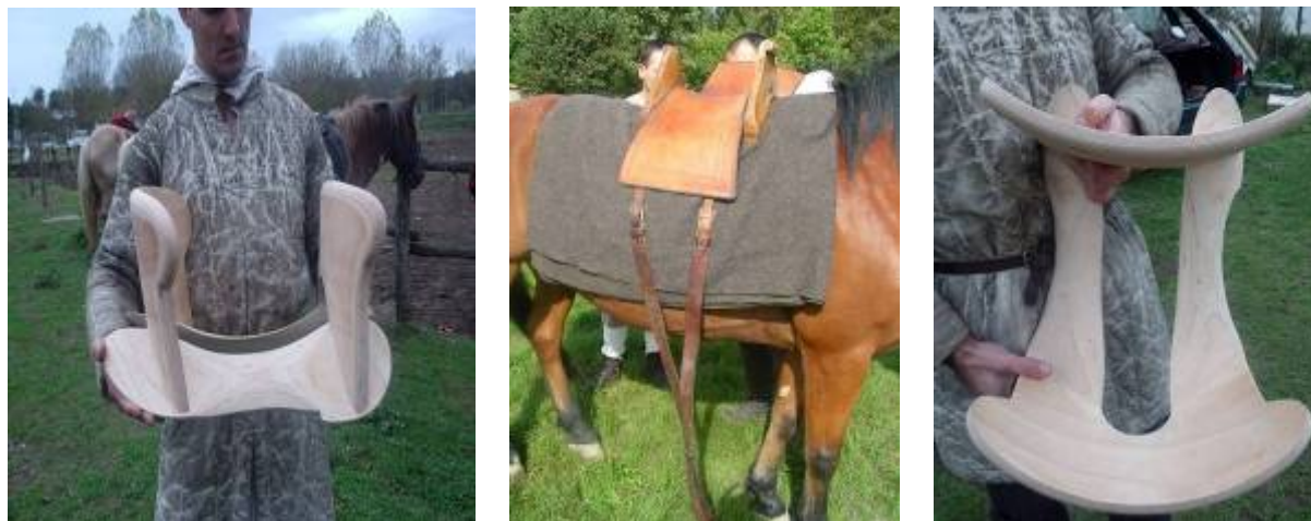
Рис. 4. Дерев'яний каркас сідла та сідло з пітником.

видає лицар в обладунках, коли рухається) при цьому кількість заліза на одязі треба збільшувати поступово, щоби кінь звикав без зайвого стресу.