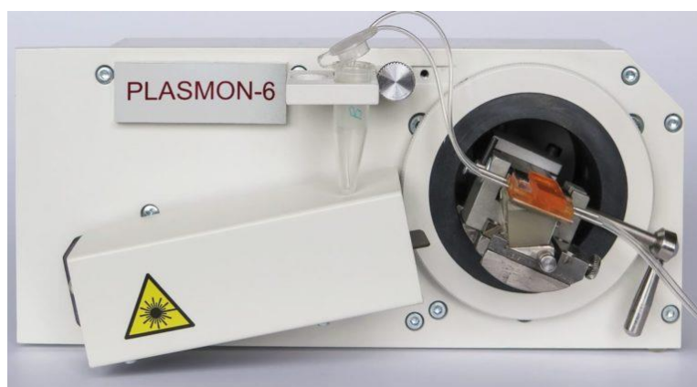
Рис. 1. Зовнішній вигляд приладу «Плазмон-6» з ППР-сенсором

Дослідження взаємодії антиген-антитіло методом ППР виконували на приладі «Плазмон-6» (рис.1), розробленому в Інституті фізики напівпровідників імені В.С. Лашкарьова НАН України [2].