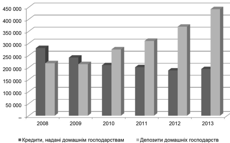
Рис. 3. Динаміка депозитів та кредитів домашніх господарств протягом 2008–2013 рр.

Оскільки питома вага коштів населення в структурі депозитного портфеля є переважаючою, ми вирішили проаналізувати динаміку зміни депозитів, залучених від домашніх господарств, а також кредити, надані цій частині економічних суб'єктів (рис. 3).