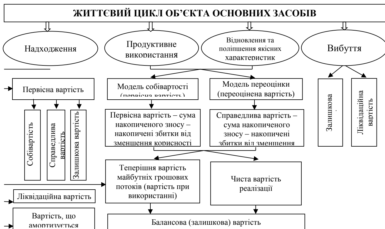
Рис. 2. Оцінка об'єктів основних засобів відповідно до стадій життєвого циклу

правдивої, тобто якісної облікової інформації у фінансовій звітності, яка виступає джерелом інформації для внутрішніх та зовнішніх користувачів щодо ефективності реалізації своїх намірів.