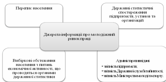
Рис. 1. Система джерел інформації про стан та розвиток молодіжного ринку праці (складено автором за даними [9])

повідомляло назву основного місця роботи, ще гірше визначався респондентами вид економічної діяльності підприємств, що у подальшому значно ускладнювало кодування відповідей. Особливо великі труднощі виникали під час надання відповідей на це запитання особами, зайнятими у малому бізнесі. Окрім того, виявилося, що певна частина працездатного населення району або перебувала у неоплачуваній тривалій відпустці, або зовсім не працювала і була зайнята якимось іншим чином, але через те, що трудові відносини з підприємством зберігалися, опитувані традиційно називали свою основну професію. Певні методологічні труднощі виникли під час визначення основного заняття осіб, у яких основним джерелом засобів існування був прибуток від особистого селянського господарства.