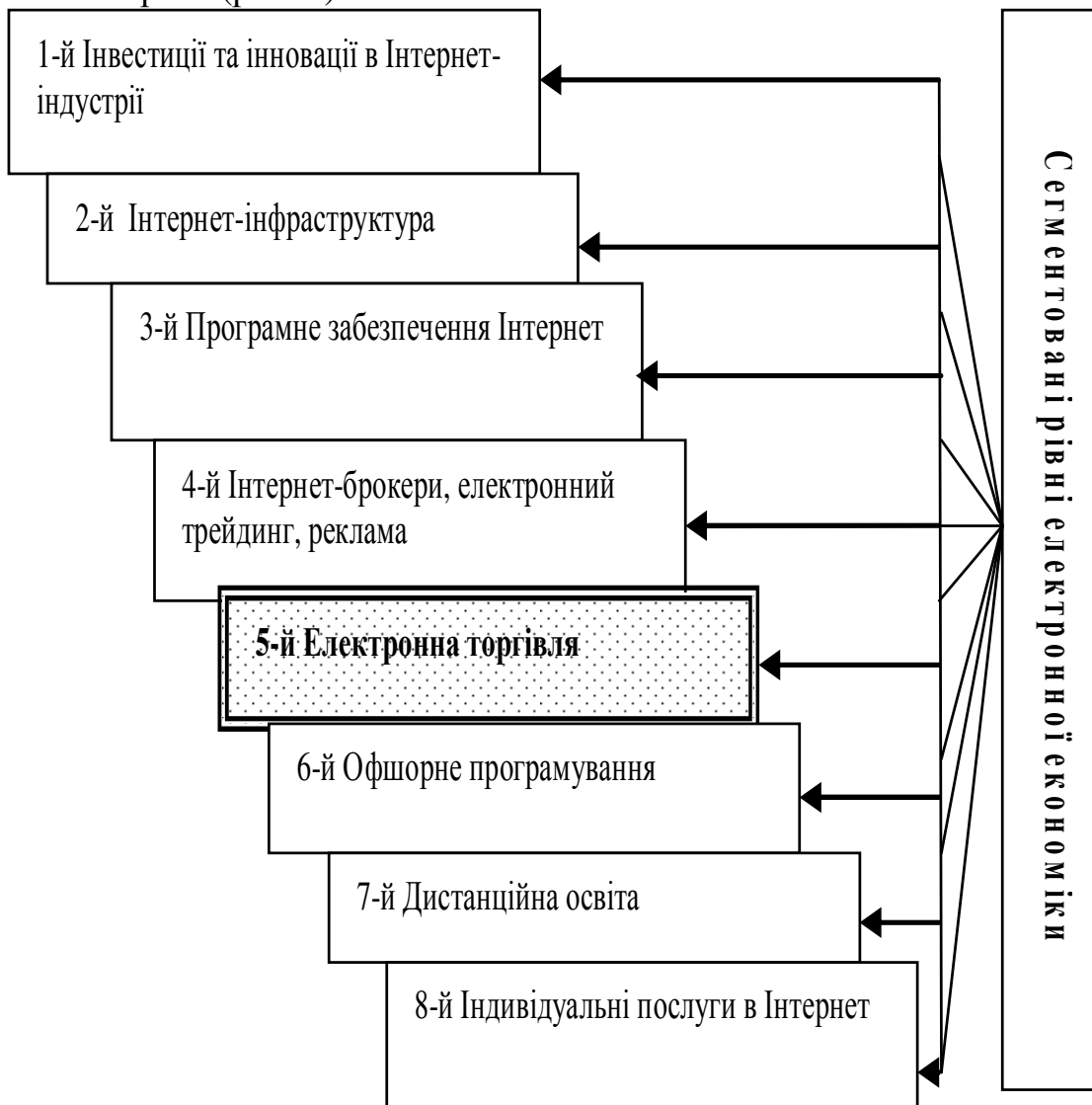
Рис. 1. Сегментовані рівні електронної економіки (розроблено автором на основі [4, с.99])

У зв'язку з цим цікавим на сегментацію рівнів електронної економіки є погляд Дятлова С.А., який виокремлює серед них такі: інвестиції та інновації в Інтернет-індустрії; Інтернет-інфраструктуру; програмне забезпечення Інтернет; Інтернет-брокерів, електронний трейдинг, рекламу; електронну торгівлю; офшорне програмування; дистанційну освіту; індивідуальні послуги в Інтернет (рис. 1).