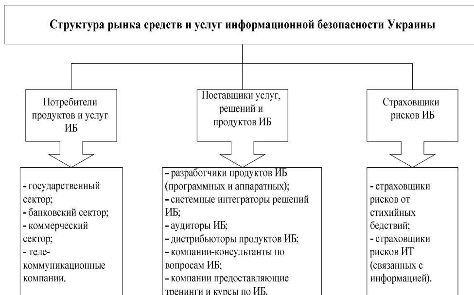
Рис. 1. Структура рынка средств и услуг информационной безопасности Украины

Следует отметить, что на территории Украины используются продукты информационной безопасности, произведенные, как правило, в других странах. В основном это производители антивирусного программного обеспечения, средства защиты от несанкционированного доступа, средства криптографической защиты и оборудование для защиты периметра, видеонаблюдения и информационных сетей.