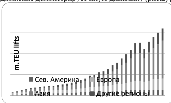
Рис. 1 Спрос на контейнерные перевозки

Безусловно, контейнерные перевозки занимают важное место в развитии международной торговли, и играют важную роль во внешнеэкономической деятельности. Как показывает статистика, с каждым годом происходит увеличение контейнерного потока во всех странах мира. Наглядно увеличение спроса на контейнерные перевозки видно на рисунке 1, однако, предложение демонстрирует иную динамику (рис.2) [1].