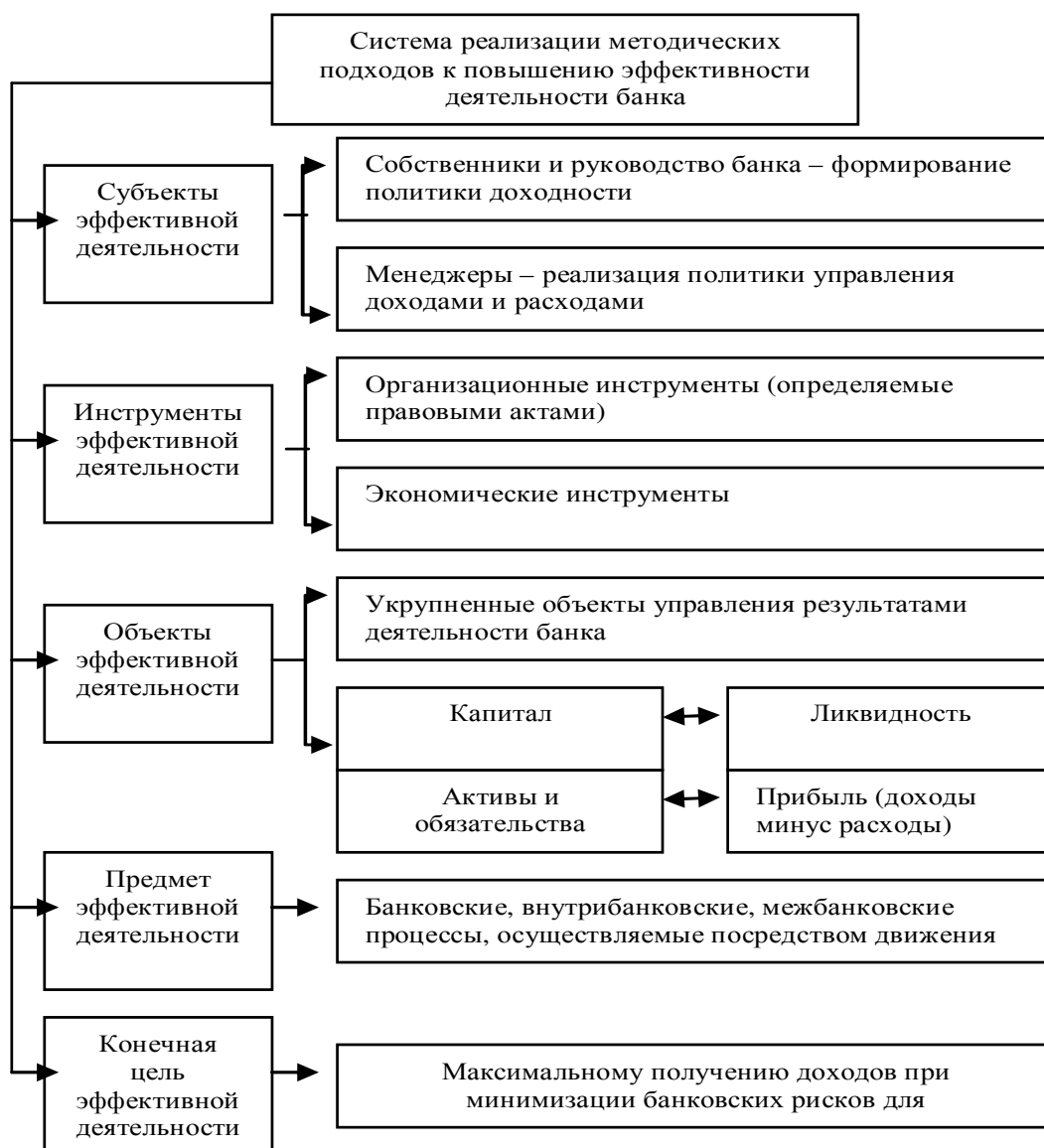
Рис. 1. Система реализации методических подходов к повышению эффективности деятельности банка (составлено автором)

эффективность деятельности современных банков зависит от множества факторов, способных стремительно меняться во времени, достижение основных задач деятельности банка зависит от качества управленческих решений, во многом определяемом качеством используемого методического и методологического обеспечения. Поэтому актуальной задачей для отдельно взятого современного традиционного, в том числе и иорданского, банка является формирование методологических основ и методических подходов к повышению эффективности деятельности иорданских банков. Соответственно, в работе сделана попытка схематично представить систему реализации методических подходов к повышению эффективной деятельности банка (рис. 1).