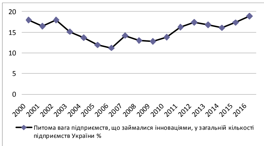
Рис. 1. Динаміка зміни питомої ваги підприємств, що займалися інноваціями, у загальній кількості підприємств України, за підсумками 2000-2016 років

Основний матеріал дослідження. Важливим чинником надійної конкурентоспроможності економіки України є узгодженість між станом інноваційної діяльності вітчизняних підприємств і потенційними можливостями підприємств нарощувати та розширювати інноваційну діяльність за різними напрямками. Для кращого розуміння інноваційних процесів і аналізу впливу інновацій на економіку, включаючи конкурентоспроможність, зайнятість, економічне зростання та структуру торгівлі, Державною службою статистики України презентовано результати обстеження інновацій за європейською методологією CIS [5]. Відповідно до третьої редакції Керівництва Осло, починаючи з обстеження CIS 2008, введено нове визначення інновацій, яке включає організаційні та маркетингові інновації. Так, аналізуючи динаміку зміни питомої ваги підприємств, що займалися інноваціями, у загальній кількості підприємств України, за підсумками 2000-2016 років, спостерігаємо їх найбільшу кількість саме у звітному 2016-му році (рис. 1).