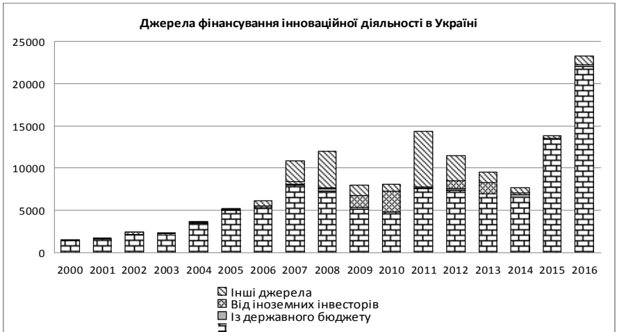
Рис. 4. Динаміка зміни структури джерел фінансування інноваційної діяльності в Україні за підсумками 2000-2016 років

Така організація облікового процесу дасть змогу фіксувати будь-яку інформацію про зміни у діяльності підприємства, одноразовим введенням.