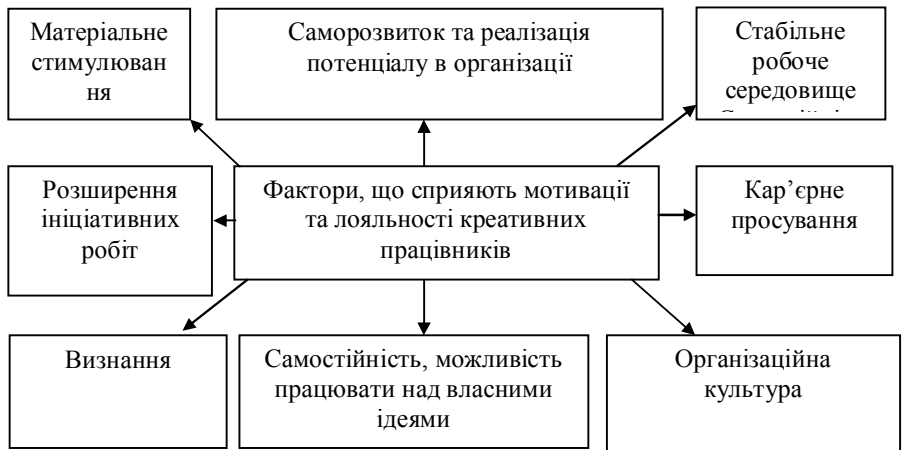
Рис. 4. Основні фактори, що сприяють мотивації та лояльності креативних працівників

Загальний аналіз факторів, що сприяють мотивації та лояльності креативних працівників подано на рис. 4.