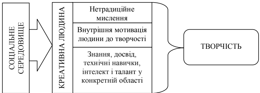
Рис. 3. Складові компоненти творчості

В 1983 році Т. Амабіль (Teresa M. Amabile), психолог Гарвардської школи бізнесу, розробила теорію творчості. Складові компоненти якої подані на рис. 3 [5].