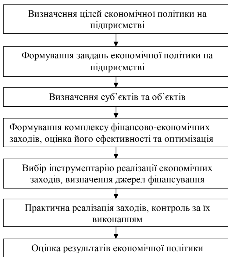
Рис. 1. Порядок формування економічної політики промислового підприємства

Формування економічної політики підприємств пропонуємо здійснювати на основі процесу, етапність якого відображена на рис. 1.