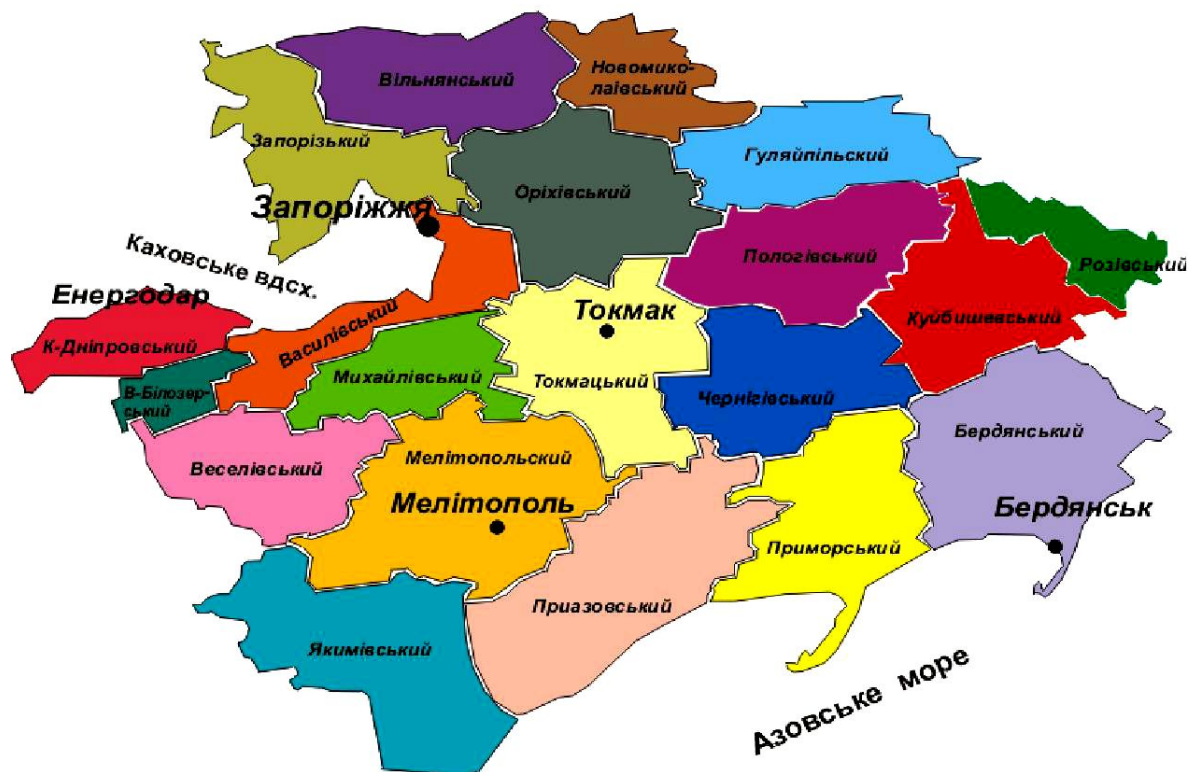
Рис.1. Сфера діяльності Запорізького НВ АПО, що пропонується на III етапі його створення та розвитку

На другому етапі (2013-2014 рр.) масштаби діяльності Запорізького НВ АПО доцільно розповсюдити, окрім Запоріжжя з вхідними в нього територіями, підзвітними мерії міста, також на організації, розташовані на прилеглих до нього територіях (Вільнянського, Оріхівського, Василівського, В.-Білозерського, Михайлівського, К.-Дніпровського, Гуляйпільського, Токмацького та Веселівського районів). Це дозволить у відповідності з вимогами ВТО виділяти без яких-небудь обмежень бюджетні кошти всіх рівнів на розвиток АПК даних територій в рамках діяльності науково-виробничих агропромислових об'єднань.