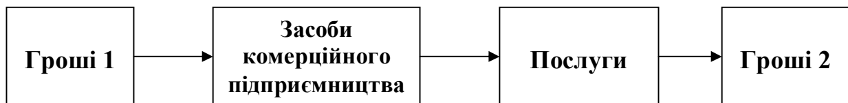
Рис.1. Схема комерційного підприємства на ринку послуг

Метою виробництва послуг для бізнес-структури є здобуття прибутку і здійснюється за логічною схемою та підкорюється ринковим законам попиту (рис.1.).