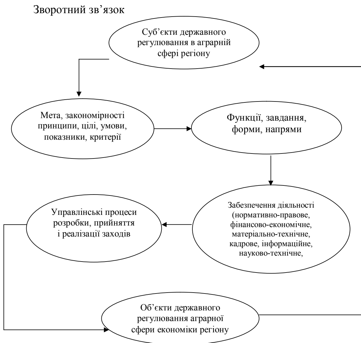
Рис. 1. Принципова схема формування впливу держави на аграрний сектор економіки як на об'єкт регулювання

Принципова схема формування впливу держави на аграрний сектор економіки як на об'єкт регулювання представлена на рис. 1.