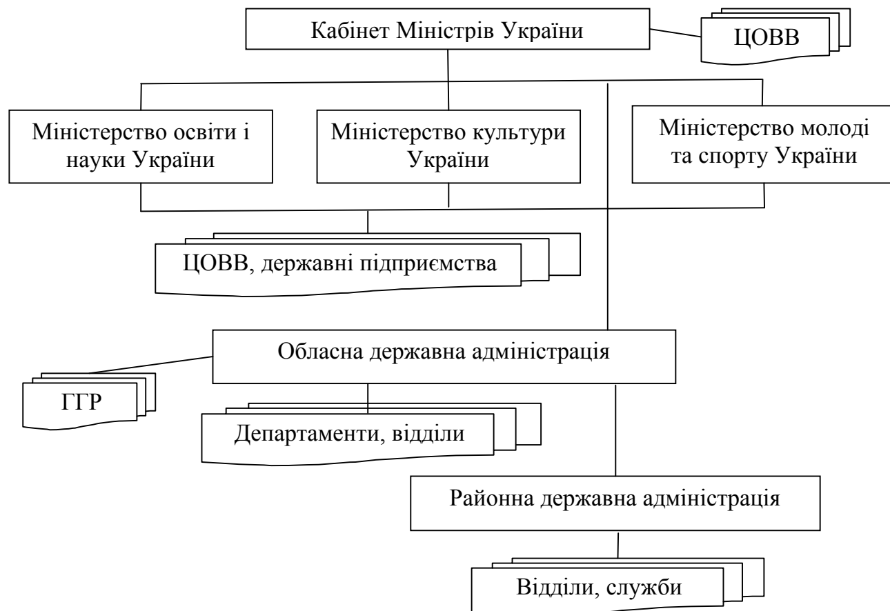
Рис. 1. Схема системи органів виконавчої влади в гуманітарній сфері України

основними напрямками роботи у віднесених до його компетенції сферах [9].