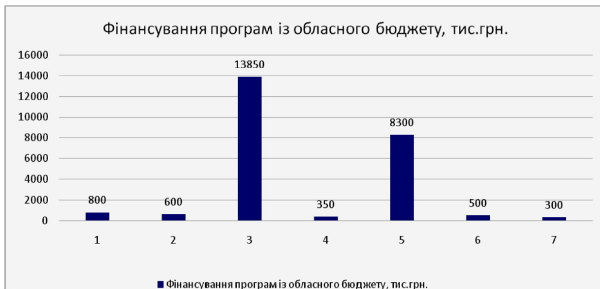
Рис. 3. Фінансування цільових програм розвитку Львівської області за напрямками, тис.грн.*

* Примітки : 1 –Програма інвестиційного розвитку Львівської області на 2011-2015 роки, рішення облради від 17.05.2011 р. № 126; 2 –Регіональна програма з міжнародного і транскордонного співробітництва, європейської інтеграції на 2012 - 2014 роки, рішення обласної ради від 16.03.2012 р. № 403; 3 –Програма розвитку освіти Львівщини на 2013-2016 роки, рішення обласної ради від 26.04.2013 № 726; 4 –програма розвитку туризму та рекреації у Львівській області на 2011-2013 роки, рішення облради від 24.05.2011 № 136; 5 –Програма та напрями використання коштів в галузі сільського та лісового господарства Львівщини на 2013 - 2015 роки, рішення обласної ради від 16.05.2013 № 760; 6 – Регіональна програма розвитку малого і середнього підприємництва у Львівській області на 2013 - 2015 роки; 7 –Регіональна цільова економічна програма енергоефективності у Львівській області на 2013 - 2015 роки.