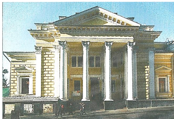
Рис.2. Московська хоральна синагога

Однак єврейська громада очікувала дозвіл на будівництво окремої спеціально призначеної молитовної споруди. У травні 1887 року розпочались роботи з будівництва споруди хоральної синагоги, запроектованої архітектором С.С. Ейбушитцом і С.К. Родіоновим, будівництво завершилось у 1891 р. [2]. Синагога у Спасоглинишівському провулку являє собою купольну базиліку. Завдяки урочистій колонаді і великому портику вона є однією з найкращих неокласичних споруд Москви (рис.2).