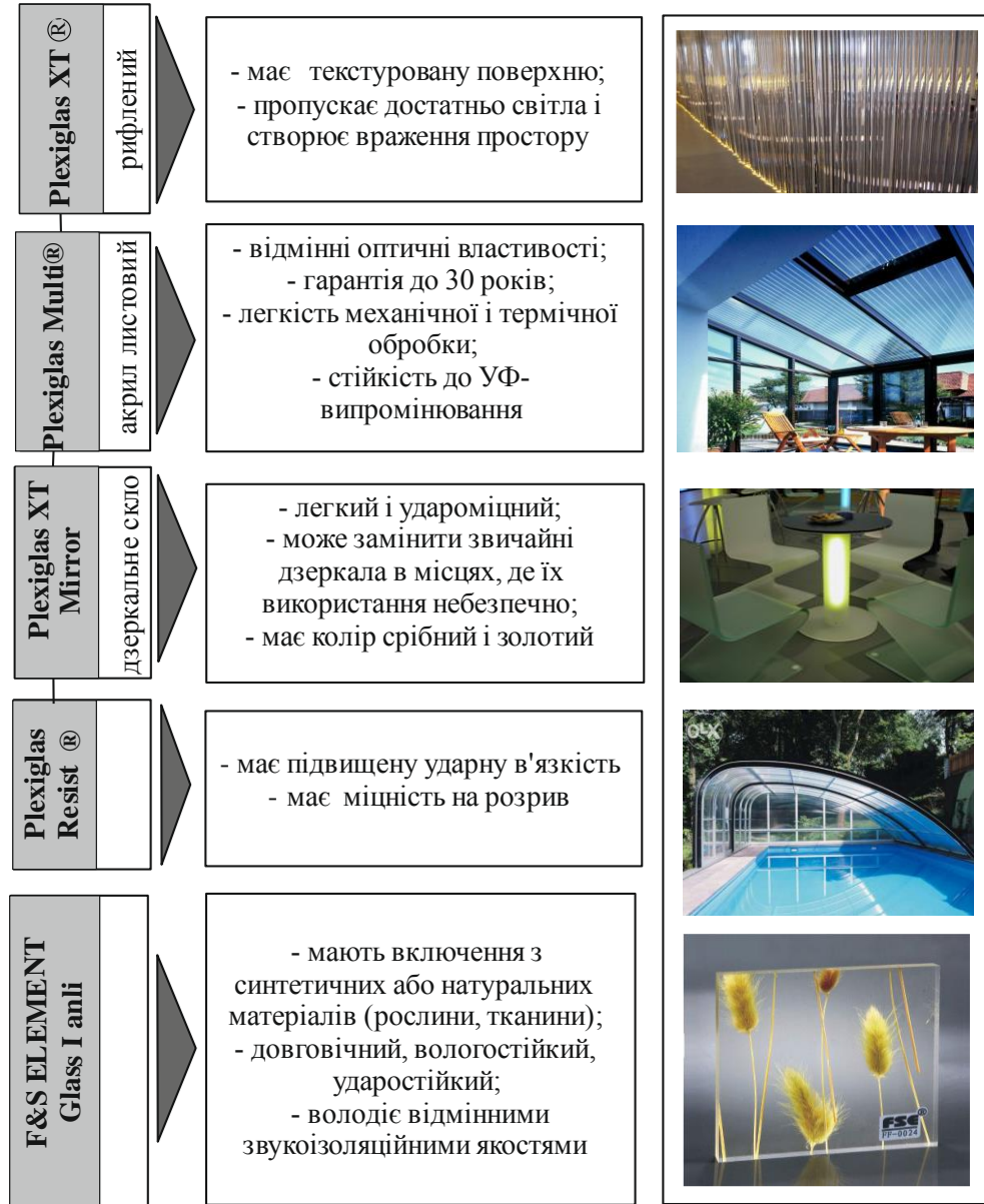
Рис. 1. Види акрилового скла та його властивості.

людей, де потрібне використання стійких до стирання матеріалів. Існує кілька видів акрилових труб і стрижнів, які також успішно використовуються в дизайні. Вони мають ті ж характеристики, що й листовий матеріал [10].