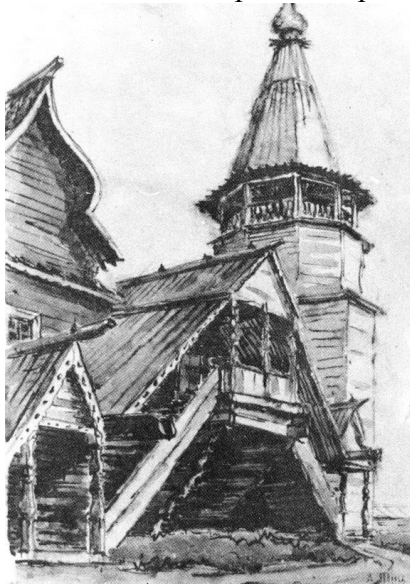
Рис. 1. На земле Архангельской

Все что мы сегодня имеем, все, чем мы славны, мы обязаны Алексею Алексеевичу. Он возродил харьковскую архитектурную школу. Свою деятельностью он сеял доброе и светлое, о чем свидетельствуют его прекрасные рисунки (рис.1-4). Семена, брошенные им, проросли бурной порослью во многих странах мира.