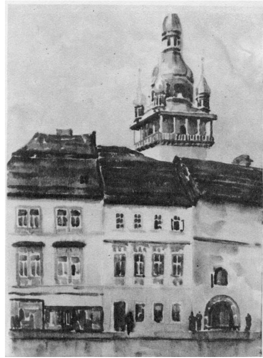
Рис. 3. Старый Брно