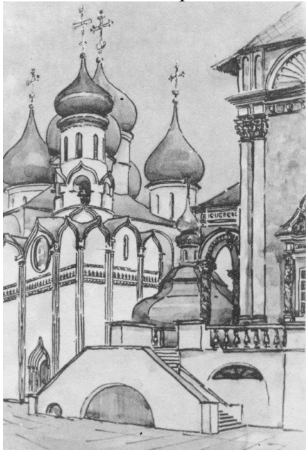
Рис. 2. Троицко-Сергиевская лавра