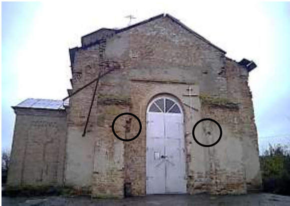
Рис. 4. Західний фасад храму (позначене місце розташування завіс)

Стіни будівлі виконані з вапняної цегли пластичного формування розміром 275x135x70 мм виготовленої на одному з 2-х цегляних заводів м. Олександрія. Перев'язка кладки виконана з використанням верстової техніки та з застосуванням вапняного розчину. Для акцентування уваги відвідувачів на майстерність мулярів, зовнішні стіни храму не були покриті штукатуркою та фарбою. Зовнішній шар цегли (85% від загальної площі) має відмінний вигляд. У місці приєднання підбанника до основної частини храму близько 10 рядів кладки були пошкоджені в результаті відсутності централізованого водовідведення з даху та розвитку кореневої системи рослин. Також від багатоциклічного заморожування та розморожування постраждала цегла, що розташована в зоні цоколю будівлі. Над вікном північного рамена виявлена одна похила тріщина, з шириною розкриття до 7 мм. Причиною її утворення слугувало розпірне зусилля від розташованого вище циліндричного склепіння. У середині храму конструкції стін та склепінь мають місця випадіння цегли та розшарування лицьової поверхні кладки. Для подальшої безпечної експлуатації будівлі храму необхідно виконати ремонтно-реставраційні роботи по їх укріпленню.