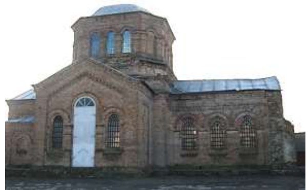
Рис. 1. Церква Святого Йосипа Обручника в с. Березівка Кіровоградської області (вид з південної сторони)

Відповідно до записів архієпископа Гавриила Разанова [6], перша дерев'яна церква була збудована в 1792-1794 рр. на кошти одного з землевласників села Йосифа Брженського на честь небесного заступника Йосипа Обручника. Приблизно через 100 років експлуатації технічний стан церкви став не придатний для подальшого використання, тому було прийняте рішення звести нову кам'яну церкву, а стару дерев'яну продати у сусіднє село за 300 рублів. З «Довідкової книги Херсонської єпархії 1906 р.» відомо, що у 1901 році був збудований новий кам'яний храм з окремо стоячою дзвіницею (рис 1) [7].