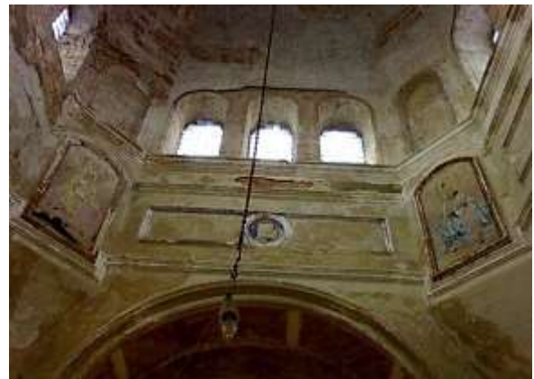
Рис. 5. Внутрішнє оздоблення храму (вигляд на вістар)

Загальна оцінка технічного стану будівлі - задовільна. Для збереження пам'ятки архітектури необхідно виконати ряд ремонтно-реставраційних робіт. Першочерговим заходом зі зменшення шкідливого впливу атмосферних явищ є заміна покриття даху храму з організацією централізованого водовідведення.