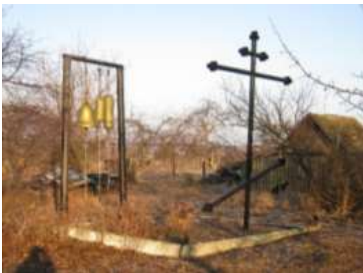
Рис. 2. Місце розташування зруйнованої дзвіниці

Відповідно до канонів храмобудівництва, вівтар церкви орієнтований на схід. Але за часів переобладнання храму під складське приміщення, перші три сходинки, які символізують схід від земного до небесного, були заасфальтовані для зручного в'їзду автотранспорту в храм. Відомо, що станом на 1901 рік при церкві було близько 30 десятин землі. На сьогодні територія храму не має огороження та благоустрою, відстань до найближчої будови становить 10 м. На місці колишньої дзвіниці встановлений хрест і підвішені на металевій рамі дзвони (рис. 2).