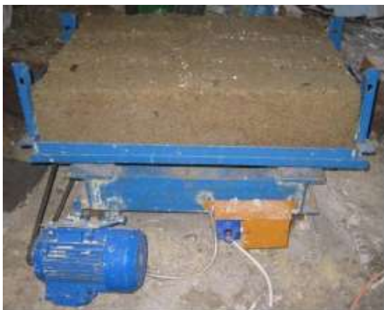
Рис. 2. Ударно-вібраційна установка

Висновки та перспективи подальших досліджень. Запропонована мето-