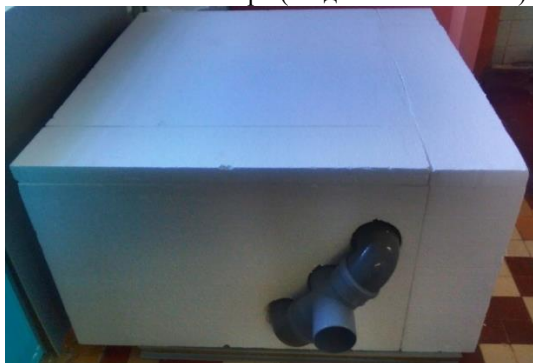
Рис. 2. Теплова камера (загальний вигляд)