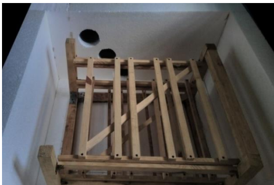
Рис. 1. Теплова камера (стадія виготовлення)

(10×10×10 см). Форми для виготовлення кубиків – спарені: в одній формі – два кубика. Тривалість твердіння плиток і кубиків у камері – одна доба.