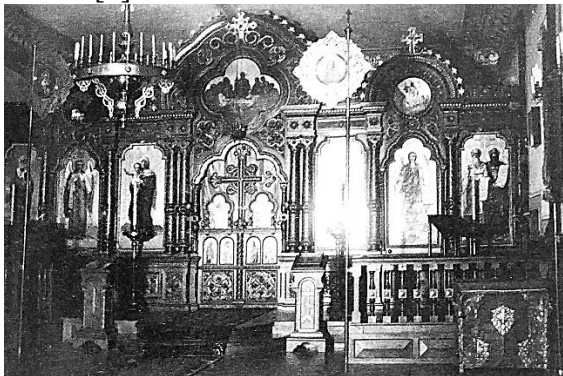
Рис. 4. Училищна домовна церква (фото 1915 р.).

виконав український живописець О. Мурашко [3] (рис. 4). Закон Божий викладав талановитий педагог, автор ряду наукових праць з історії Поділля, священник І. О. Шипович [3].