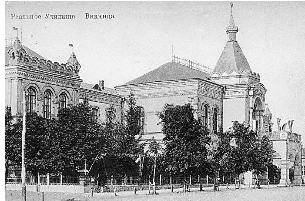
Рис. 1. Будівля учбового корпусу Вінницького реального училища (з листівки 1900-х рр.).

стилю. Нівелювання культу деталі та прийняття узагальненого трактування форми в архітектурі, на противагу еkleктизму, дозволило створити нове джерело художньої виразності підпорядкованої імперській ідеології.