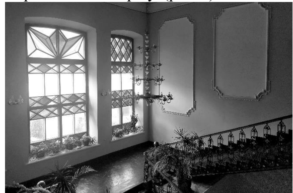
Рис. 3. Організація простору сходової клітки (фото автора, 2017 р.).

Коридорне планування відповідало сучасним вимогам організації простору навчального закладу. Класні кімнати світлі, просторі, мали пічне опалення. У вестибюлі – парадні багатомаршеві чавунні сходи, на яких викарбуваний напис, що зберігся до наших днів: “Чугунно-литейный и механический заводъ. Винница”. [7] Промені, що пронизують яскраве вітражне панно, чудово освітлюють внутрішній простір сходового маршу. (рис. 3)