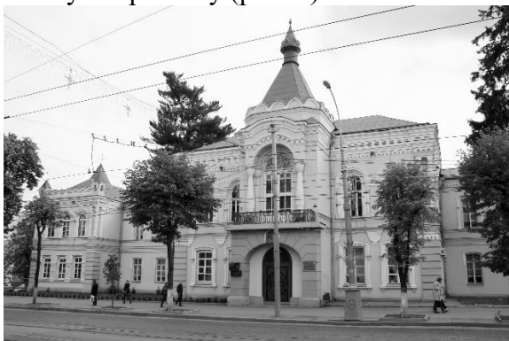
Рис. 5. Будівля ВТЕІ КНТЕУ.

Нині тут розмістився Вінницький торговельно-економічний інститут Київського національного торговельно-економічного університету (рис. 5).