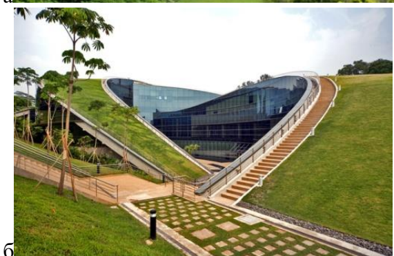
Рис. 5. Будівля навчального корпусу Наньянського технологічного університету [10]: а - вигляд будівлі в контексті навколишнього середовища, б - вигляд зі сторони входу у внутрішній двір.

Результати дослідження. Аналіз будівель ВНЗ виявив, що в ході історичного розвитку в архітектурі склалися дві універсальні моделі побудови будівлі ВНЗ, які відображаючи розвиток світової культури і науки, відрізняються композиційними прийомами, засобами та принципами формоутворення. Перша з них – це класична модель побудови будівлі ВНЗ, заснована на ордерній системі, яка із епохи в епоху на протязі багатьох тисячоліть в тій чи іншій формі була присутня в архітектурі ренесансу, бароко, класицизму та неокласицизму. Для такого типу громадських споруд як будівлі ВНЗ вона остаточно сформувалась в XVII –XVIII ст. Друга ж модель – це сучасна модель побудови будівлі ВНЗ, що остаточно сформулювалась в XXI столітті в повній опозиції до ордерної класики. Сучасна модель повністю відкинула ордер та декоративні елементи. Чинниками формування даної моделі стали