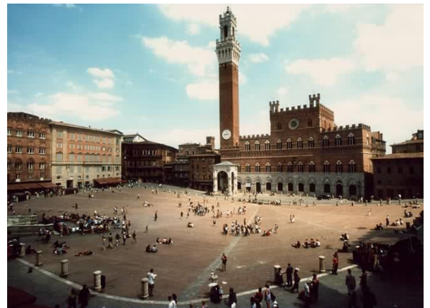
Рис. 1 Найстаріший навчальний корпус Сієнського університету [14]: а- вигляд в забудові, б –вигляд з площі та головний фасад

Відродження (XIV століття – XVI століття) характеризується антифеодальністю, гуманістичним світоглядом, зверненням до культурної спадщини античності та її «відродженням», обґрунтуванням права науки і розуму на незалежність від церкви, світським нецерковним характером культури та літератури [13]. Гуманістична педагогіка характеризується повагою до дітей, запереченням фізичних покарань, прагненням до вдосконалення здібностей дітей. Але на жаль ідеологія епохи Відродження, яка наповнила середньовічну освіту новим гуманістичним змістом та майже не змінила її.