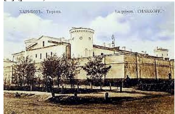
Рис. 1. Здание тюремного замка. Типовой проект. Арх. И.-И. Шарлемань-Бодэ, 1820-е гг.

В период раннего и зрелого классицизма в архитектуре Российской империи вполне успешно совмещались средневековые, барочные и классицистические формы [4] (рис. 1).