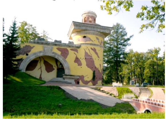
Рис. 3. Баиня-руина в Царском Селе. Арх. Ю. М. Фельтен, 1771 г.

Также в это время в архитектуре стала популярной тема средневековых развалин, руин, наводившая на романтические размышления о минувших временах. В 70-е гг. XVIII в. замки и руины в средневековом духе стали неременным атрибутом вошедшего в моду «живописного английского сада» (рис 3).