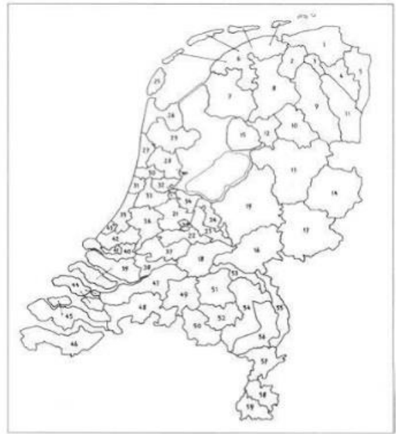
Рис. 4. Деление Нидерландов на культурно-исторические области согласно проекту MIP. Источник: http://www.nationaalgeoregister.nl/geonetwork/srv/dut/catalog.search#/metadata/b18a0c7c-1120-414a-b023-68629c8a1da5

Все Нидерланды были подразделены на шестьдесят культурно-исторических областей (рис.4). В течение года специальной рабочей группой Нидерландского департамента по охране национальных памятников существующий план инвентаризации памятников был переработан в проект с собственной организационной структурой, бюджетом и руководством – проект инвентаризации памятников (MIP) [33].