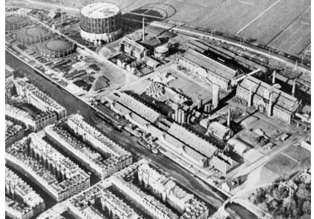
Рис. 2. Фабрика Вестергас в Амстердаме.

Гааге и фабрика Вестергас в Амстердаме (рис. 2).