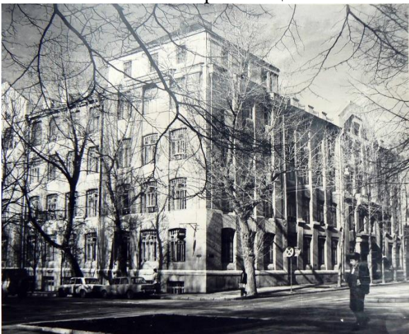
Рис. 1. Вул. Мироносицька, 1. 1980-ті рр.