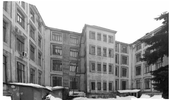
Рис. 2. Фрагмент дворового фасаду. 2013 р.