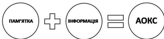
Рис. 2. Схема впливу інформаційного масиву на формування архітектурного об'єкту культурної спадщини.

об'єктів, включених до списку пам'яток національного та місцевого значення не підкріплені інформаційною базою. На думку В. Глазичева: «Пока объект культуры не осознан как ценность в системе популярной культуры, он лишь «полупамятник». Для того, чтобы перевести его в другое состояние, необходимо создать для него «раму», показать его особым образом, вывести его из состояния «дома без хозяина». Есть путь – через вовлечение объекта культуры в круг естественных ценностей популярной культуры – через описание, через присвоение, через освоение и потребление памятника как общественной ценности» [7]. За теперішніх умов, усі зазначені вище дії можливо виконати за допомогою головного інструменту сучасного суспільства – за допомогою інформації. Жоден об'єкт не може бути введений у суспільну культуру та систему цінностей за відсутності вичерпної кількості інформації стосовно цього об'єкту. Таким чином, можна стверджувати, що саме ототожнення матеріального об'єкту із масивом інформації перетворює пам'ятку на дійсний архітектурний об'єкт культурної спадщини (рис. 2).