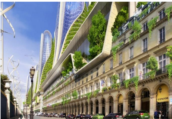
Рис. 2. «2050 Paris Smart City», торгова вулиця Рю де Риво́лі (Rue de Rivoli).

Справедливості раді, треба сказати, що проект привертає увагу, але нічого не залишає від старого Парижу. Можливо, його реалізація ніколи не відбудеться, хоча вже сам підхід до світової культурної спадщини викликає занепокоєність.