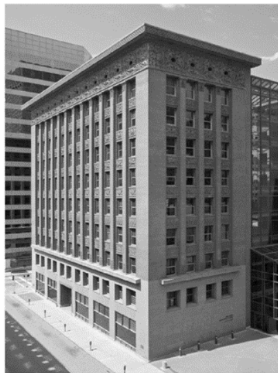
Назва: Будівля "Уейнрайт" (Wainwright State Office Building)