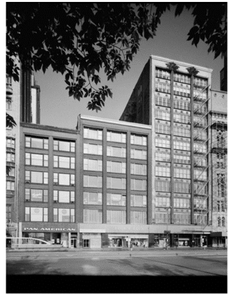
Назва: Будинок "Гейдж Груп" (Gage Group Buildings)