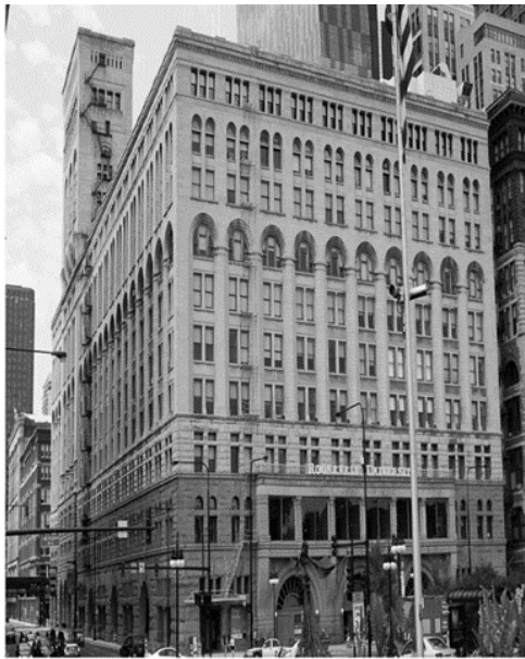
Назва: Будівля "Аудиторіум" (Auditorium Building)