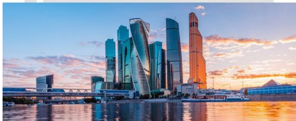
Рис. 3. Скайлайн міста Москва (графічне зображення з www.vexels.com )

Хоча і можна виділити деякі відмінності у різних регіонах планети при оновленні архітектурних ландшафтів сучасними хмарочосами, але з упевненістю можна стверджувати, що в світі з'являється нове урбанізоване єдине середовище. Його розміри значно перевищують архітектурні об'єми попередніх століть. Воно по різному «вживлюється» та накладається на застаріваючу міську тканину. При цьому воно різко трансформує і просторову, і образну структуру сформованого великого міста, активно вводячи нові символічні коди глобальності за допомогою архітектури [15]. Ці знаки зчитуються з багаторівневих форм хмарочосів та ребристих профілів міст, що являються іміджевою рекламою найдорожчих майданчиків планети. Найважливішими елементами