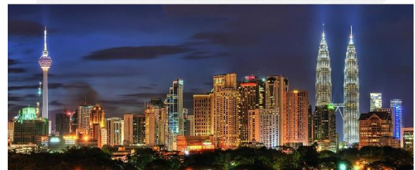
Рис. 4. Скайлайн міста Куала-Лумпур