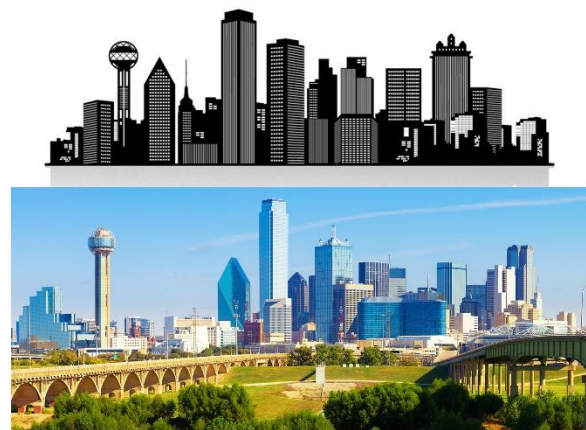
Рис. 2. Скайлайн міста Даллас (графічне зображення з www.vexels.com )

Сучасні транснаціональні компанії, як правило, обирають розташування своїх штабів у висотних будівлях. Зазвичай будівництво корпоративних будівель не має на меті індивідуалізувати міський фасад. Швидше, це відбувається з прагнення деяких забудовників виділити будь-якими засобами своє місце серед інших вертикалей. В окремих випадках приймається поверховість будівлі, що перевищує навіть перспективні потреби. Корпорації не настільки зацікавлені в будівництві нової ділової будівлі, як жадають мати вертикальну рекламу посиленої дії у вигляді хмарочоса. Але такі корпоративні зусилля здатні привести до появи нової оригінальної форми хмарочоса і внести індивідуальність у вигляд міста [14]. Такий підхід, коли спочатку формується конкурентоспроможний імідж компаній, який переноситься на архітектуру корпоративних висотних будівель, а з цих будівель складається силует міста, притаманний для мегаполісів Атлантичного Світового міста. Приклади таких силуетів можна побачити у Нью-Йорку, Чикаго, Сан-Франциско, Далласі та в ін. північноамериканських мегаполісах (рис. 2).