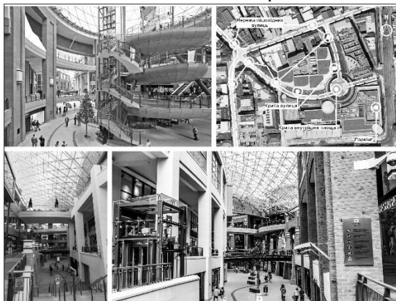
Рис. 3 Критий громадський простір The Victoria Square, Белфаст, 2008 р.

4) відокремлений громадський простір – представлений окремо розташованим «залом» у міському середовищі, в якому можливе проведення громадських заходів.