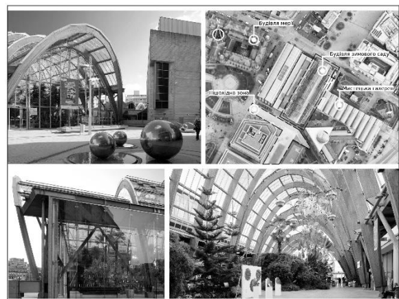
Рис. 4 Критий громадський простір The Winter Garden, Шеффілд, 2002 р.

Цілісність художнього образу архітектурного об'єкта є основним критерієм при створенні форми [10]. Так само й елементи міського інтер'єру повинні бути узгоджені на різних рівнях, щоб досягти цілісності форми та сприйняття об'єктів.