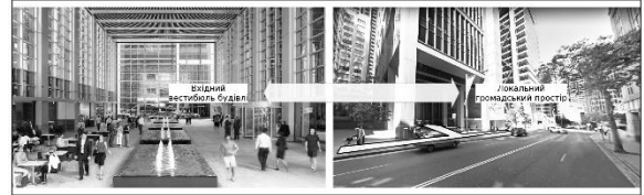
Рис. 1. Критий громадський простір будівлі Deutsche Bank Place, Сідней, 2005 р.

відвідувачів зустрічає крита громадська площа, що слугує в якості офісного лобі, де розміщені кафе, магазини та водні інсталяції (рис. 1) [6]. Цей громадський простір також пов'язаний з центральним атриумом, що проходить крізь всю висоту будівлі банку та створює комфорту психологічну атмосферу для співробітників;