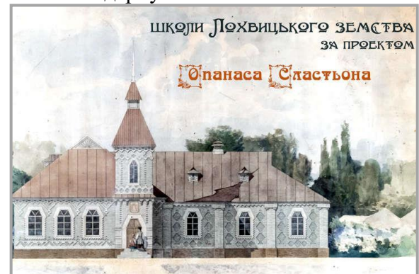
Рис. 1. Ескіз фасаду будівлі школи. Автор О. Сластьон

типовими проектами ХХ століття. Вони представляють значний доробок спадщини стильового напрямку традиційного українського модерну.