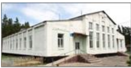
Рис. 5. Вовчанська міська загальноосвітня школа № 6.