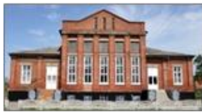
Рис. 4. Вовчанська міська загальноосвітня школа № 4.