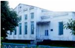
Рис. 7. Вовчанська міська загальноосвітня школа № 4.