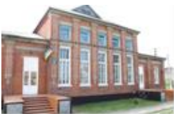
Рис. 3. Вовчанська міська загальноосвітня школа № 3.