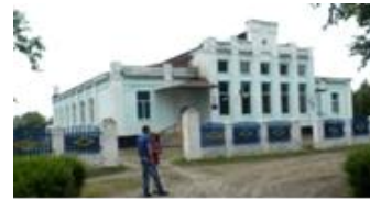
Рис. 9. Вовчансько-хуторянська сільська загальноосвітня школа. с. Вовчанські Хутора