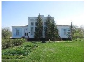
Рис. 8. Волохівська сільська загальноосвітня школа.

Серед цих проектів, розглядаються варіанти планувань двох -, трьох -, п'яти -, шести - і семикомплектних шкіл. Схема планування запропонованих проектів – анфіладна. Навчальні класи розташовані навколо центрального об'єму. Центральна зала мала змінну функцію: від залу для спортивних занять, до залу для виступів і театралізованих вистав. В таких випадках в торці була передбачена пересувна перегородка, за допомогою якої відкривалася невелика сцена. На сьогоднішній день така функція втрачена, в торцях обладнані підсобні і господарські приміщення. Рішення фасадів частково змінено. Це пов'язано з реконструкцією будівель у післявоєнні роки. Внаслідок, фронтони чотирьох