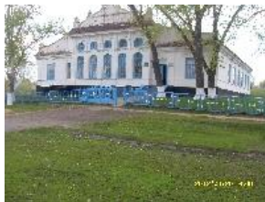
Рис. 6. Новоолександрівська сільська загальноосвітня школа