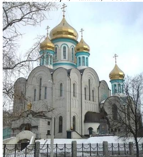
Рис. 2. Репликация с незначительными изменениями Владимиро-Суздальской архитектуры XII века. Храм Святого Архистратига Михаила, Харьков, Украина, 2011 г.