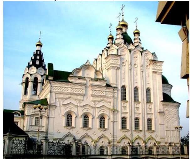
Рис. 6. Церковь Пресвятой Троицы, Йошкар-Ола, Марий Эл, Россия, 2009 г.

IV Конструктивный минимализм (рис. 7; 8). Представляет собой сборно-разборный конструктор из фасонных железобетонных деталей (арок, колонн, поясов), металла и массивов стекла – своего рода интерпретация культовой архитектуры в индустриальном мировидении.