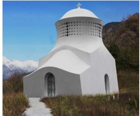
Рис. 10. Проект малого храма для Русского Юга. ТО «Квадратура круга»