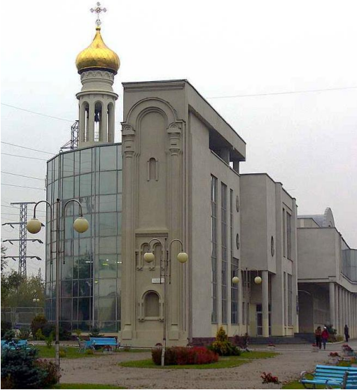
Рис. 7. Церковь Иоанна Рыльского, Минск, Беларусь, 2000 г.