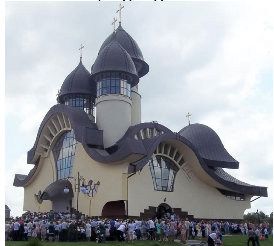
Рис. 11. Храм святых Владимира и Ольги в Ходорове, Львов, Украина, 1996 г.