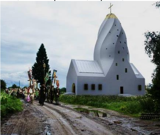
Рис. 9. Проект храма сошествия Святого Духа, Россия. ТО «Квадратура круга»