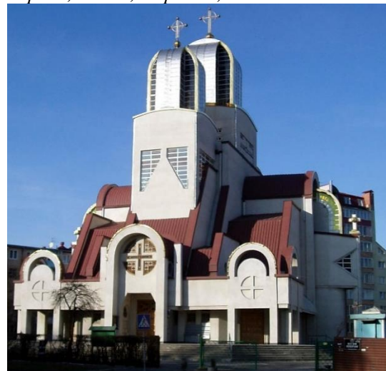
Рис. 12. Церковь Положения Пояса Пресвятой Богородицы, Львов, Украина, 1994 г.

Выводы. Сегодня на фоне социокультурных обновлений и восстановления утраченных святынь после почти вековой паузы