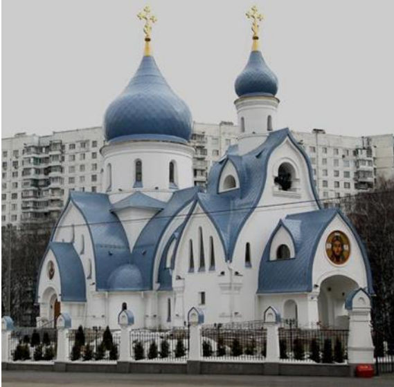
Рис. 3. Подражание русскому модерну. Церковь Покрова Пресвятой Богородицы, Москва, 2015 г.

II Подражание историческим стилям, стилевые ремейки, псевдоисторизм (рис. 3; 4). Данный подход характерен для архитекторов, понимающих архитектуру сквозь систематизацию шаблонов стилей, школ и национальных предпочтений.