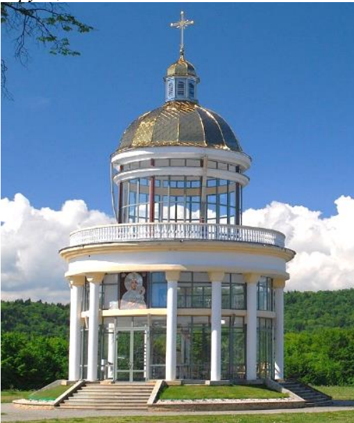
Рис. 8. Церковь-ротонда на Ясной Горе в Гошеве, Ивано-Франковск, Украина, 2012 г.