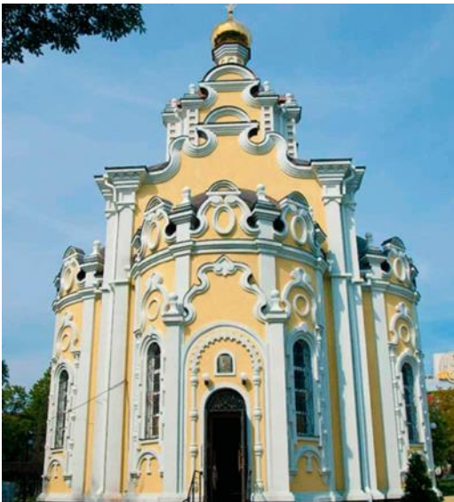
Рис. 4. Подражание «украинскому барокко». Церковь иконы Божией Матери «Взыскание погибших», Харьков, Украина, 2008 г.

III Компиляция, коллаж различных элементов из различных традиций, стилей и эпох (рис. 5; 6). Своего рода смешение исторического и стилового подходов в фантазийных, порой трудно сочетаемых гибридах.