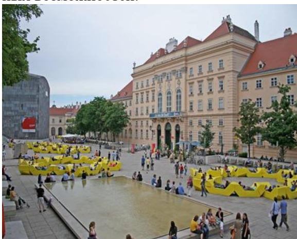
Рис. 1. Музейный квартал, Вена

Площади: исторически формирование площадей обусловлено потребностью реализации функции общественных пространств. Моно- или полифункциональные, они обладали всеми необходимыми ресурсами для развития при условии сохранения первоначальной функции (торговой, рекреационной, культовой), и привнесения, и трансформации дополнительных возможностей.